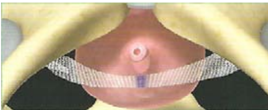
Afbeelding 2.